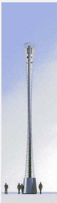
Zone Neutre Installazione di antenne su palo costituente arredo urbano