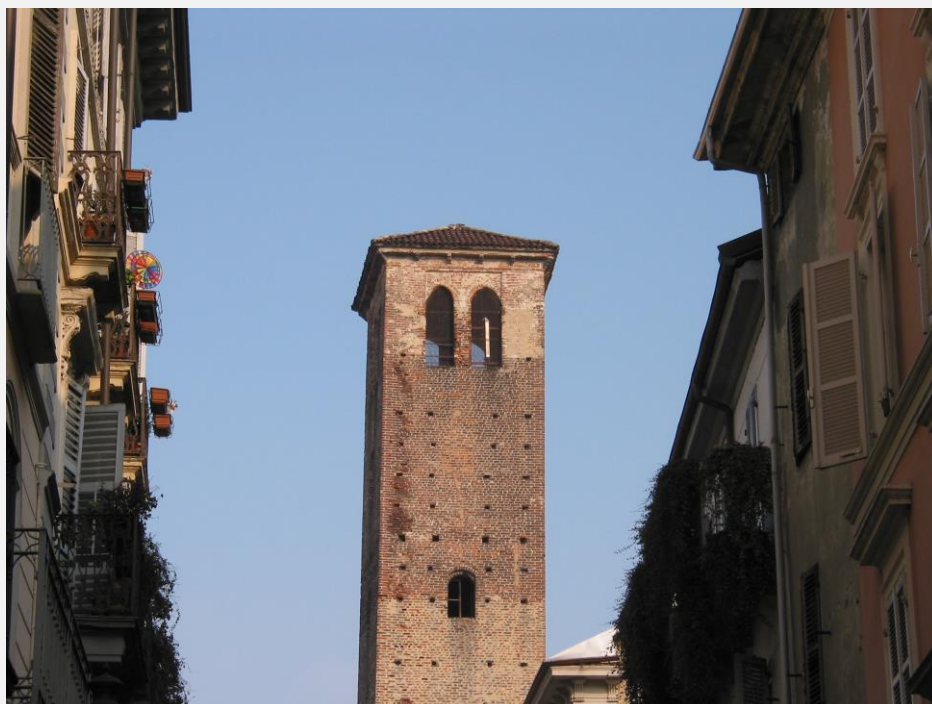
Zone di Installazione Condizionata Mimetizzazione dell'impianto