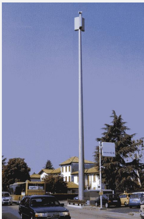
Zone Neutre Installazione di antenne su palo con elementi per la mimetizzazione