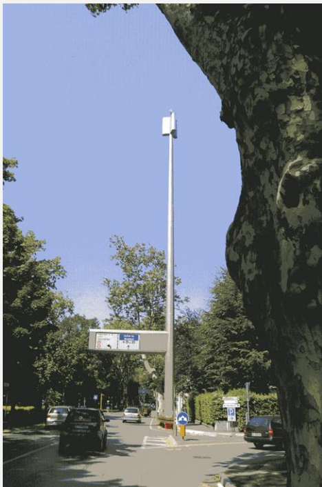
Zone Neutre Installazione di antenne su palo con elementi per la mimetizzazione