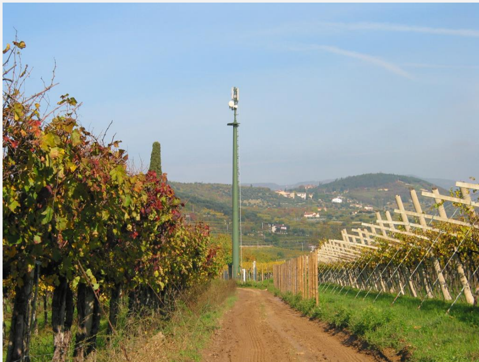
Zone Neutre Installazione di antenne su palo mimetizzato