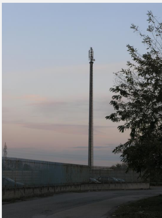
Zone Neutre Installazione di antenne su palo e co-siting