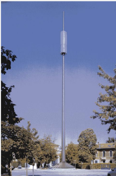
Zone Neutre Installazione di antenne su palo costituente arredo urbano