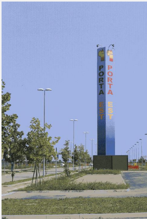
Zone Neutre Installazione di antenne su palo mimetizzato