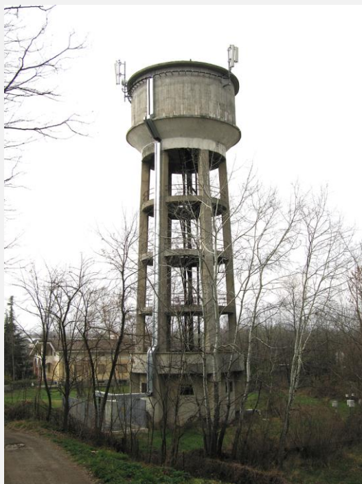
Zone Neutre Installazione di antenne su strutture di sostegno preesistenti