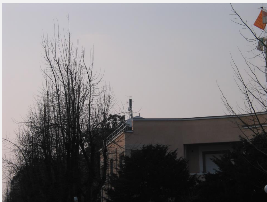
Zone di Installazione Condizionata Impianto non sporgente dal colmo o da altri corpi edilizi esistenti per più di 4,50 m