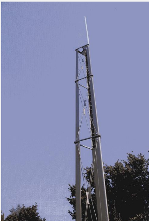
Zone Neutre Installazione di antenne su palo costituente arredo urbano