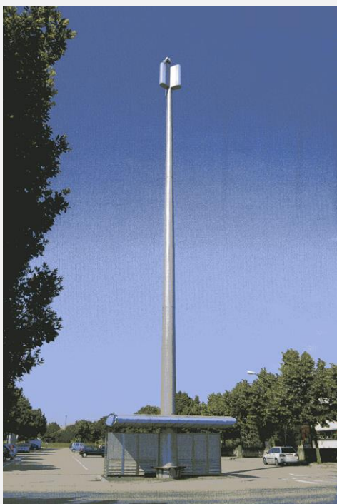
Zone Neutre Installazione di antenne su palo con elementi per la mimetizzazione