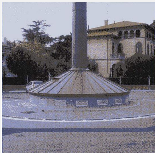
Zone Neutre Shelter mimetizzato